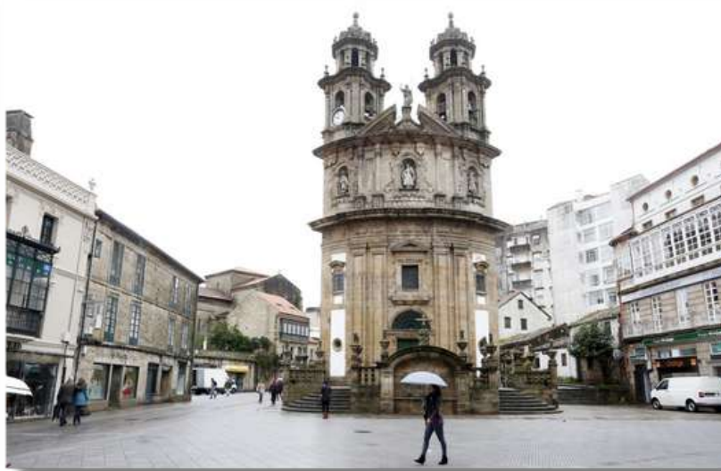
2 días en Pontevedra