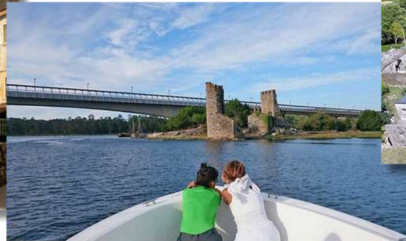
Viaje en Barco en la 4ª etapa