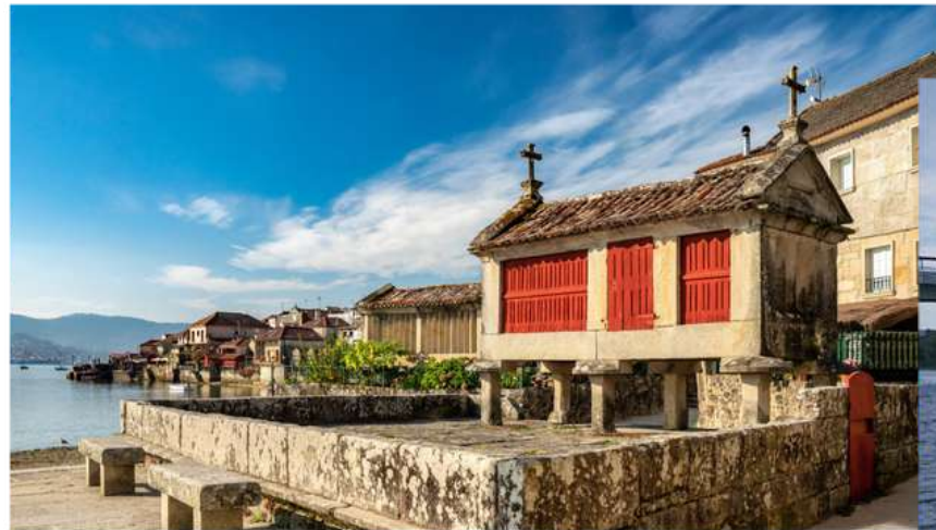
Visitar Combarro durante la 2ª etapa