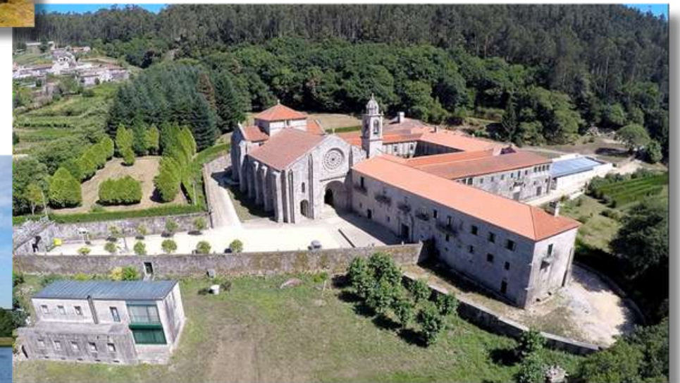
Monasterio de Armenteira tras la 2ª etapa