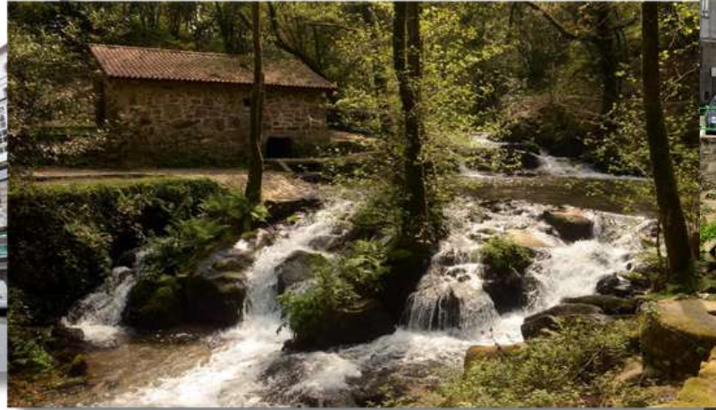
Ruta da Pedra durante la 3ª etapa